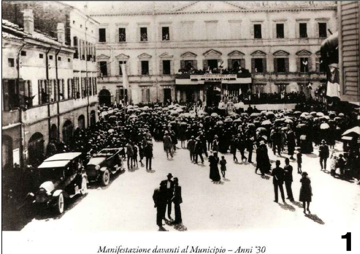
Manifestazione davanti al Municipio – Anni '30

Il valore storico della piazza e l'importanza dell'intervento richiedono di bandire un concorso d'idee per la progettazione architettonica dell'isolato, concorso fondato sugli obiettivi sopra indicati e su una preliminare ricognizione partecipata delle idee e delle disponibilità dei proprietari.