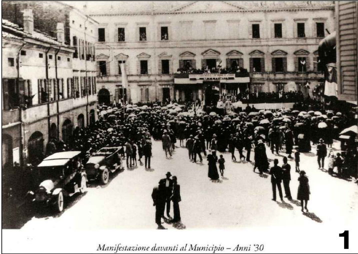
Manifestazione davanti al Municipio – Anni '30

Il valore storico della piazza e l'importanza dell'intervento richiedono di bandire un concorso d'idee per la progettazione architettonica dell'isolato, concorso fondato sugli obiettivi sopra indicati e su una preliminare ricognizione partecipata delle idee e delle disponibilità dei proprietari.