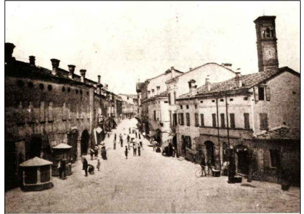
"Saluti e Baci" da Concordia – Cartolina 1912