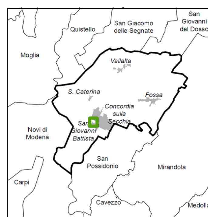
Tavola A 04 Scala 1:500 PERIMETRAZIONI