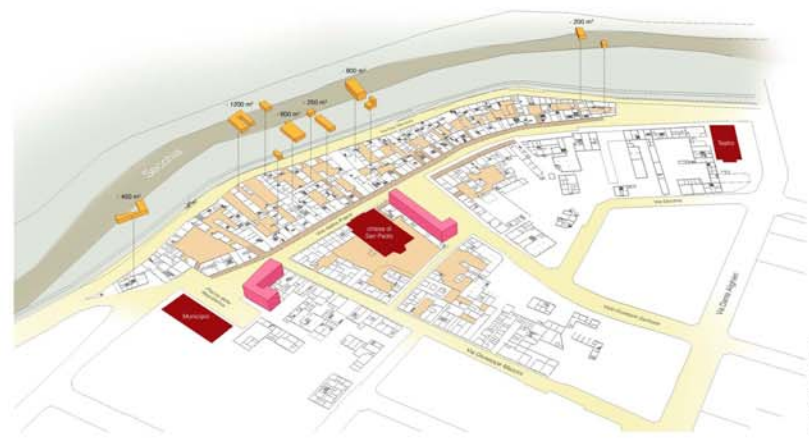
POTENZIALE DI DELOCALIZZAZIONE DEI VOLUMI PER IL NUOVO EDIFICIO DELLA PIAZZA