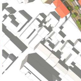
SUGGERIMENTI PROGETTUALI DELLA NUOVA PIAZZA