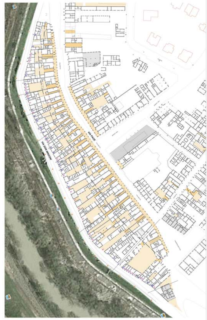
PERIMETRAZIONE DELLE UMI E MASTERPLAN