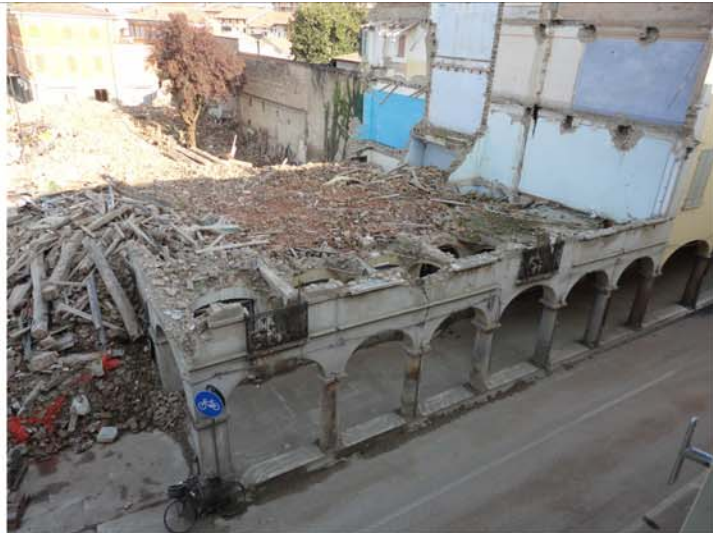
E LA DEVASTAZIONE DEL SISMA